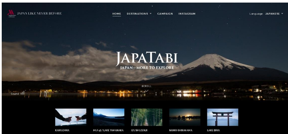
「JapaTabi.com」トップページイメージ

2016年末、年間の訪日外国人旅行者数が、ついに史上最高の2400万人台に到達しました。今後も2020年の東京オリンピック開催に向け、日本への関心が高まることから、近年中には「インバウンド4000万人時代」が訪れることが予測されています。